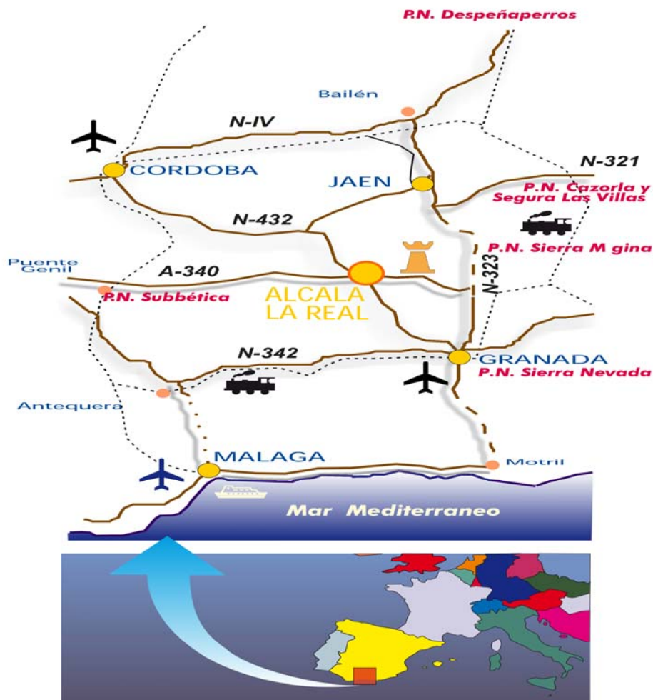
Ilustración de las principales infraestructuras cercanas al municipio

Al encontrarse la localidad en este punto intermedio dentro de la Comunidad Autónoma facilita mucho la logística y las comunicaciones ya que no existen grandes distancias entre los principales núcleos de población de Andalucía, además de tener cerca aeropuertos, puertos y estaciones de trenes.